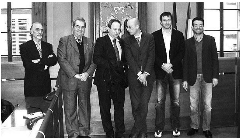
NO AL DOPING La presentazione dell'evento che si è svolta nel Comune di Empoli

che l'incasso della giornata sarà devoluto all'Associazione vittime del doping, fondata da Claudia Beatrice , figlia dell'ex calciatore viola Bruno , con lo scopo di sensibilizzare l'opinione pubblica sui rischi derivanti dall'uso di sostanze illecite nello sport. Le iniziative di contrasto al doping, tuttavia, non si esauriranno oggi. Infatti, grazie alla sinergia instaurata fra "Rete di Comunicazione Democratica", Iride srl (società che gestisce gli impianti sportivi del Comune di Lastra a Signa) e la manifestazione pistoiese "Memorial Giampaolo Bardelli", prenderà corpo la seconda edizione della "Settimana dello sport etico in Toscana". Iniziative